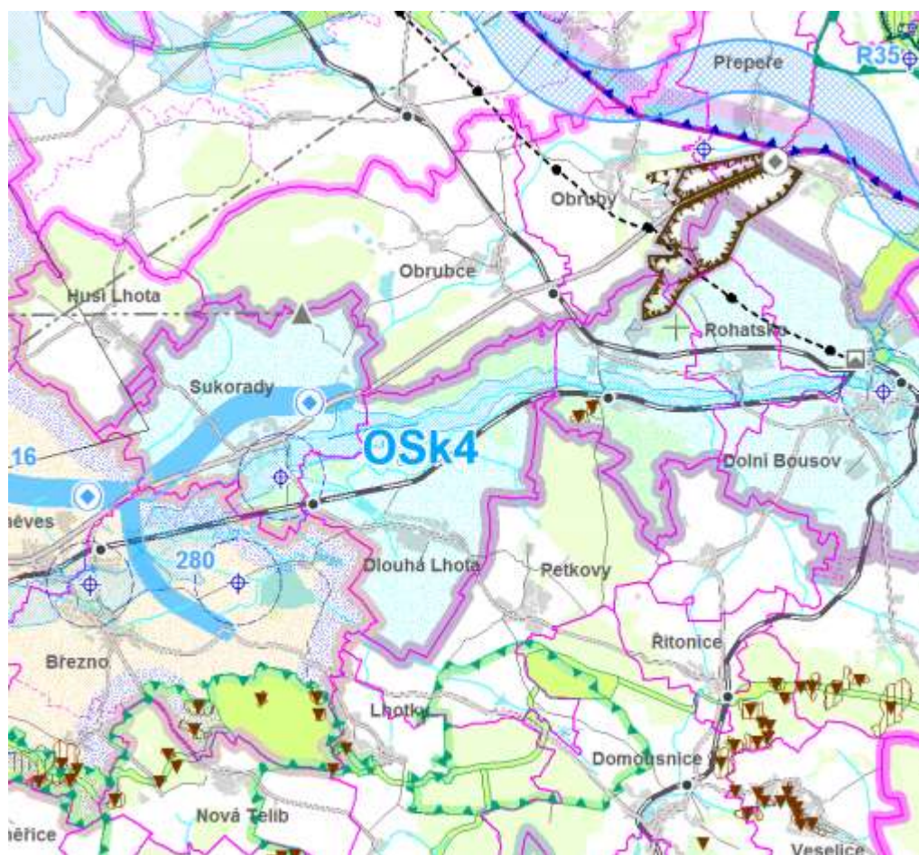
Výřez z koordinčního výkresu ZÚR SK

Pro území obce jsou nadřazenou územně plánovací dokumentací Zásady územního rozvoje Středočeského kraje, vydány 19. 12. 2011 s nabytím účinnosti dne 22. 2. 2012. Následně byla usnesením č. 007-18/2015/ZK ze dne 27. 7. 2015 zastupitelstvem Středočeského kraje schválena aktualizace č. 1 ZÚR Středočeského kraje, která nabyla účinnosti dne 26. 8. 2015 a usnesením č. 022-13/2018/ZK ze dne 26. 4. 2018 zastupitelstvem Středočeského kraje schválena aktualizace č. 2 ZÚR Středočeského kraje, která nabyla účinnosti dne 4. 9. 2018 (dále jen „ZÚR SK“).